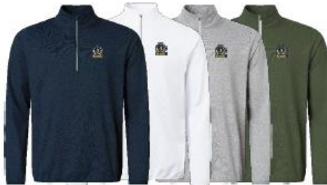
Jr Cradoc halfzip fleece

Medlemserbjudande: 559:- Ordinarie pris: 699:-