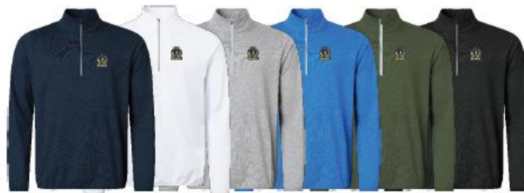
Mens Cradoc halfzip fleece

Medlemserbjudande: 719:- Ordinarie pris: 899:-