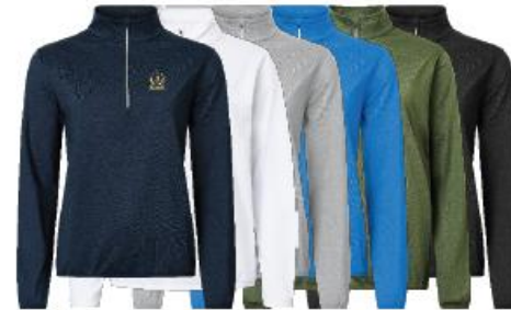
Lds Cradoc halfzip fleece

Medlemserbjudande: 799:- Ordinarie pris: 999:-