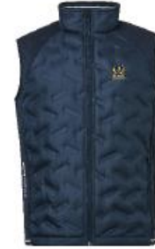
Jr Grove hybrid vest

Medlemserbjudande: 959:- Ordinarie pris: 1199:-