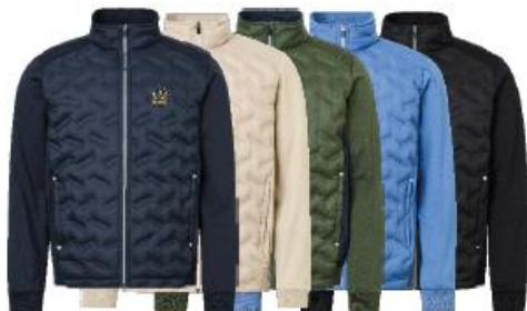
Mens Portrush hybrid jacket