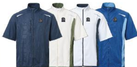
Mens Lanark stretch windshirt

Medlemserbjudande: 719:- Ordinarie pris: 899:-