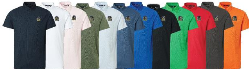
Mens Cray drycool polo

Medlemserbjudande: 799:- Ordinarie pris: 999:-