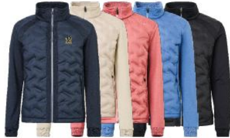
Lds Portrush hybrid jacket