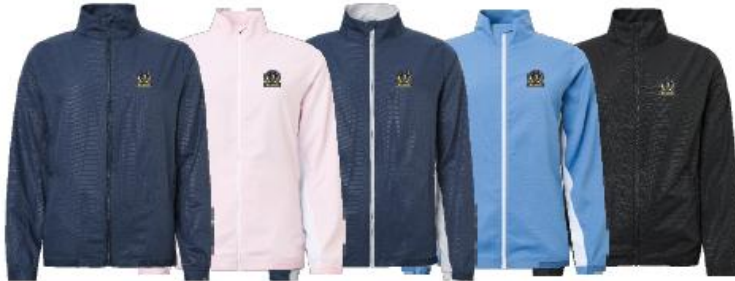
Lds Lanark classics stretch wind jacket

Medlemserbjudande: 1199:- Ordinarie pris: 1499:-