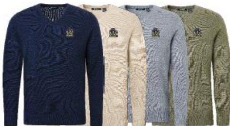
Mens Liffin V-neck pullover

Medlemserbjudande: 639:- Ordinarie pris: 799:-