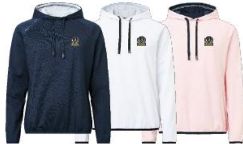
Lds Loop hoodie