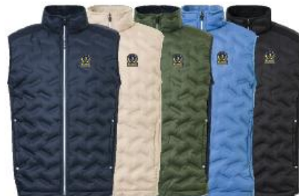
Mens Portrush hybrid vest

Medlemserbjudande: 1359:- Ordinarie pris: 1699:-