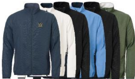
Mens Lanark classics stretch windjacket

Medlemserbjudande: 1199:- Ordinarie pris: 1499:-