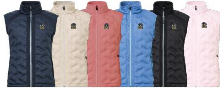
Lds Portrush hybrid vest

Medlemserbjudande: 1359:- Ordinarie pris: 1699:-