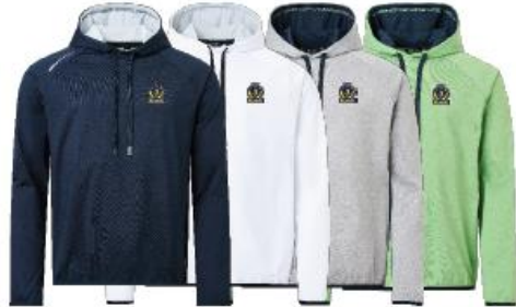
Mens Loop hoodie