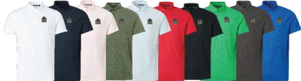
Jr Cray drycool polo

Medlemserbjudande: 479:- Ordinarie pris: 599:-