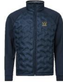
Jr Grove hybrid jacket

Medlemserbjudande: 639:- Ordinarie pris: 799:-