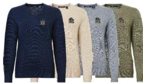
Lds Liffin V-neck pullover

Medlemserbjudande: 719:- Ordinarie pris: 899:-