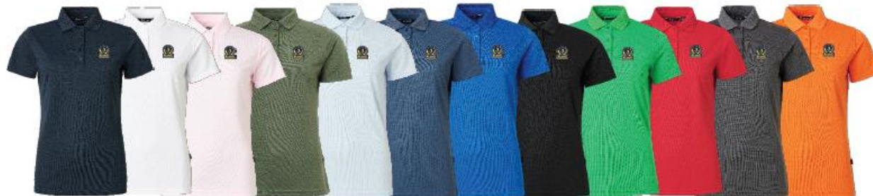
Lds Cray drycool polo

Medlemserbjudande: 639:- Ordinarie pris: 799:-