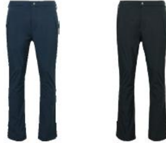
Jr Links rain trousers

Medlemserbjudande: 959:- Ordinarie pris: 1199:-