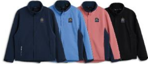
Jr Links stretch rainjacket