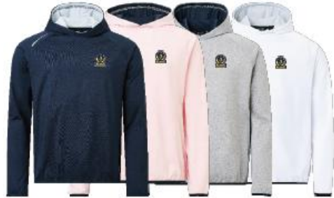
Jr Loop hoodie

Medlemserbjudande: 799:- Ordinarie pris: 999:-