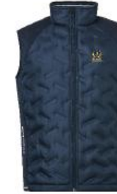
Jr Grove hybrid vest

Medlemserbjudande: 959:- Ordinarie pris: 1199:-