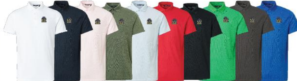
Jr Cray drycool polo

Medlemserbjudande: 479:- Ordinarie pris: 599:-